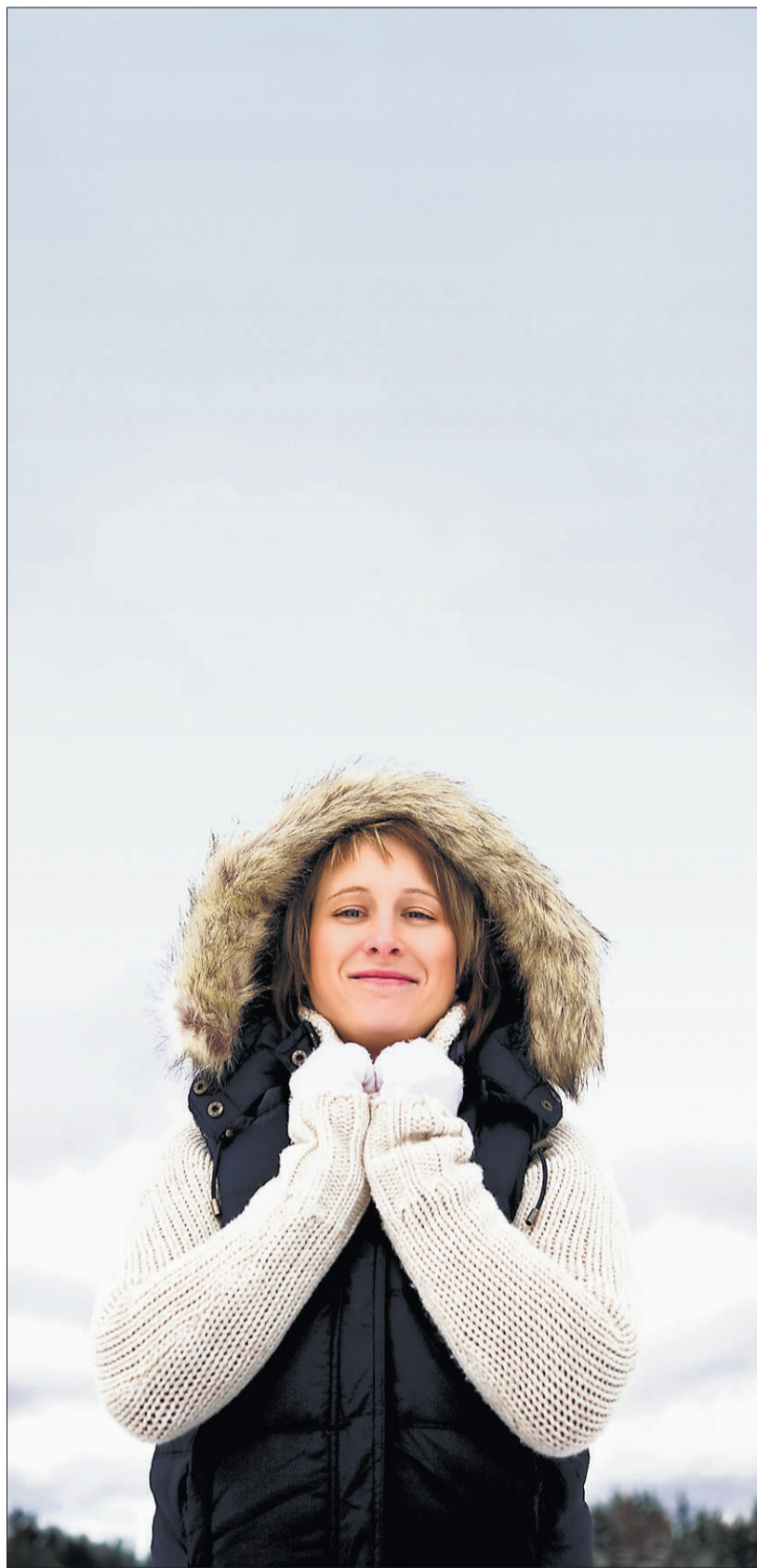
Warm anziehen ist selbstverständlich, doch auch Hautpflege sollte Pflicht sein.

Im Winter sollte man täglich einhalb bis zwei Liter Flüssigkeit zu sich nehmen, um die zu Trockenheit neigende Haut optimal von innen mit Feuchtigkeit zu versorgen.